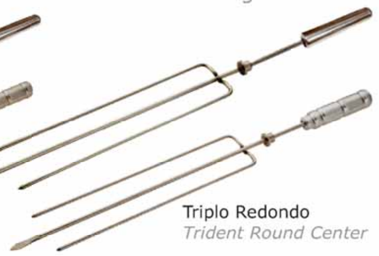
Triplo Redondo Trident Round Center