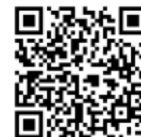
Tabela de Preço Mercado interno ( não incluso: frete )