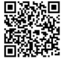
Tabela de Preço Mercado interno ( não incluso: frete )