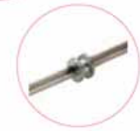
Roldana Zamac Zamac Roller