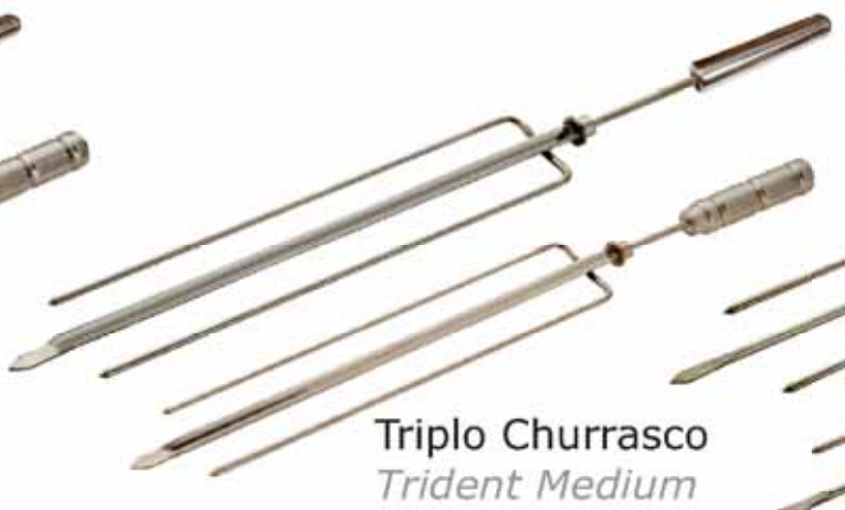
Triplo Churrasco Trident Medium